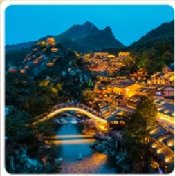
หุบเขาวังเซียนกู่