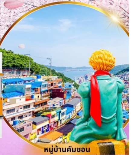
หมู่บ้านคิมซอน