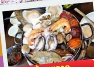
ห้ามพลาด ช้อปปิ้ง ตลาดดังแฮอนแด