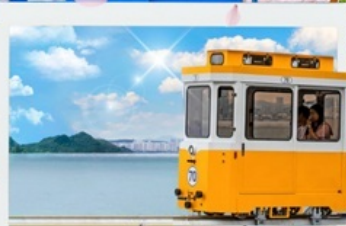
รถไฟลอยฟ้า Sky Capsule