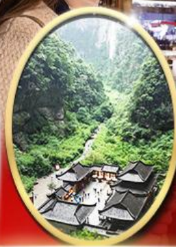
อุทยานหลุมฟ้า สะพาน สวรรค์