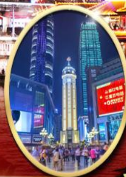
ถนนคนเดินเจี่ยฟางเป็ย

ไฮไลท์ พิเศษ! สุกี้ยาล่ำ 1 มื้อ พักโรงแรม 4 ดาว 4 คืน ไฮไลท์ สุดจ้าว! ขึ้นลิฟท์แก้วชมความ อลังการ กลางหุบเขา