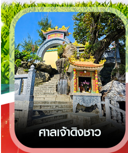
ศาลเจ้าดิ้งขาว