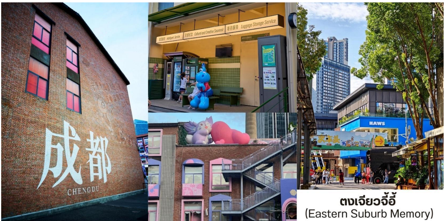
ตงเจียวจี้ (Eastern Suburb Memory)

เที่ยง บริการอาหารกลางวัน ณ ภัตตาคาร พิเศษ...สุกี้เสฉวน