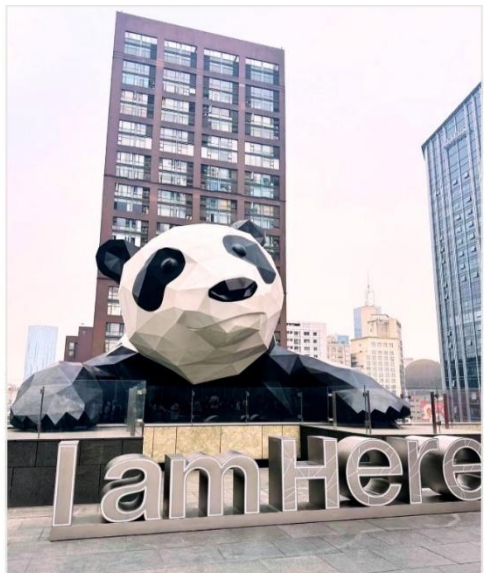
หมีแพนด้ายักษ์ กำลังปีนตึก IFS