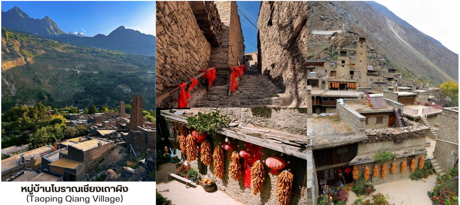
หมู่บ้านโบราณเชียงเตาผิง (Taoping Qiang Village)

อนุรักษ์ไว้ดีที่สุดในเขตของชนเผ่าเชียง (Qiang) ที่นี้มีความโดดเด่นไม่เหมือนใครด้วยสถาปัตยกรรมแบบ "ป้อมปราการหิน" ซึ่งเป็นเอกลักษณ์ของชนเผ่านี้ ทำให้หมู่บ้านดูเหมือนเขาวงกตที่ซับซ้อนและน่าค้นหา เมื่อก้าวเข้าสู่ถ้ำผิงเชียงจ่าย คุณจะรู้สึกเหมือนได้ย้อนเวลากลับไปในอดีต บ้านเรือนและกำแพงทุกหลังสร้างจากหินล้วน ๆ โดยไม่ใช้ปูนซีเมนต์ แต่ใช้หินซ้อนกันอย่างมีศิลปะจนกลายเป็นโครงสร้างที่มั่นคงและแข็งแรง ระบบการออกแบบหมู่บ้านยังมีความซับซ้อนด้วยทางเดินใต้ดินและทางเดินบนหลังคาที่เชื่อมต่อถึงกัน ทำให้เกิดเป็นเขาวงกตที่สามารถใช้หลบภัยและป้องกันศัตรูในสมัยโบราณได้ มีระบบส่งน้ำใต้ดินและบนดินที่ชาญฉลาด น้ำไหลทั่วถึงทุกครัวเรือน ได้ชื่อว่า "หมู่บ้านที่ไม่เคยขาดน้ำ" จากนั้นนำท่านเดินทางสู่ เมืองเฉิงตู (Chengdu, 成都)