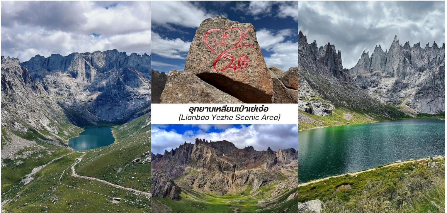
อุทยานเหลียนเป่าเย่เจ้อ (Lianbao Yezhe Scenic Area)

นำท่านเข้าชม อุทยานเหลียนเป่าเย่เจ้อ (Lianbao Yezhe Scenic Area) รวมค่าบริการรดน้ำเที่ยวภายในอุทยาน) ตั้งอยู่ในเขตที่ราบสูงอาปา มณฑลเสฉวน ประเทศจีนที่นี้คือขุมทรัพย์ทางธรรมชาติที่ยังคงความบริสุทธิ์ไว้อย่างสมบูรณ์เป็นสถานที่ท่องเที่ยวที่ได้ชื่อว่าเป็น “สวรรค์แห่งภูเขาและ ทะเลสาบ” ด้วยทิวทัศน์ อันยิ่งใหญ่และงดงาม หัวใจของเหลียนเป่าเย่เจ้อคือความอลังการของ ยอดเขาหิบนแกรนิต ที่มีรูปทรงแปลกตาและแหลมคมนับไม่ถ้วนมีความสลับซับซ้อน คล้ายกับป้อมปราการธรรมชาติ ยอดเขาสีเทาดำเหล่านี้ตั้งตระหง่าน อยู่ท่ามกลางผืนดินที่เขียวชอุ่มและรายล้อมด้วย ทะเลสาบสีมรกตและสีคราม ที่ใสราวกับกระจก ทะเลสาบแต่ละแห่งสะท้อนภาพของยอดเขาได้อย่างสมบูรณ์แบบราวกับเป็นภาพวาดในจินตนาการอย่างงดงาม