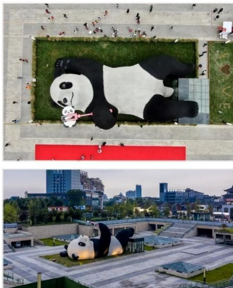
รูปปั้นแพนด้าเซลฟี