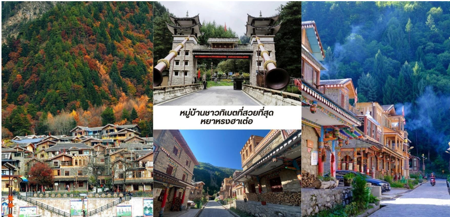
หมู่บ้านชาวกิเบตที่สวยงามที่สุด หย่าหงฮาเต๋อ

บ่าย นำท่านชม หมู่บ้านชาวกิเบตที่สวยงามที่สุด หย่าหงฮาเต๋อ (Yangrong Hades, 羊茸哈德) หมู่บ้าน แห่งนี้เคยเป็นหมู่บ้านยากจนบนภูเขา แต่ด้วยการย้ายถิ่นฐานและพัฒนาการท่องเที่ยว ทำให้กลายเป็นจุดหมาย ปลายทางที่ดึงดูดนักท่องเที่ยวจากทั่วโลก ทัศนียภาพอันงดงาม หย่าหงฮาเต๋อล้อมรอบด้วยภูเขาสูง มีแม่น้ำเฮย์ส่วย (黑水河) ไหลผ่าน และป่าไม้เขียวชอุ่มตลอดปี โดยเฉพาะในฤดูใบไม้ร่วง ป่าไม้จะเปลี่ยนเป็นสีสดใสของใบไม้เปลี่ยนสี ทำให้ทั้งหมู่บ้านดูเหมือนอยู่ในภาพวาดอันงดงาม หมู่บ้านนี้ยังคงรักษาเอกลักษณ์วัฒนธรรมกิเบตดั้งเดิม ทั้งการ แต่งกาย อาหารท้องถิ่น และพิธีกรรมทางศาสนา หย่าหงฮาเต๋อ ไม่เพียงแต่เป็นสถานที่ท่องเที่ยวที่สวยงาม เท่านั้น แต่ยังเป็นหมู่บ้านที่สะท้อนให้เห็นถึงการพัฒนาจากความยากจนสู่ความมั่งคั่งผ่านการผสมผสานการอนุรักษ์วัฒนธรรม ดั้งเดิมกับการท่องเที่ยวได้อย่างลงตัว