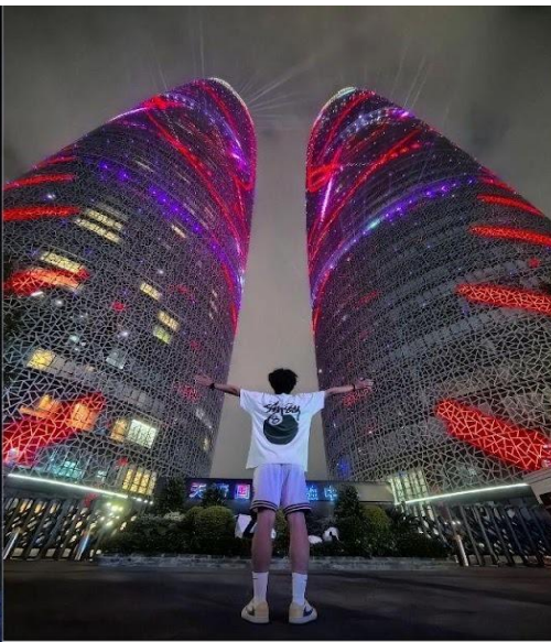
ตึกแฝดเทียนฟู่ (Tianfu International Financial Center Towers)