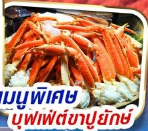
เมนูพิเศษ บุฟเฟ่ต์ซาปูยักษ์