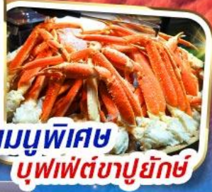
เมนูพิเศษ บุฟเฟ่ต์ซาปูยักษ์