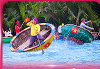
ล่องเรือกระดัง หมู่บ้านกิมทาน