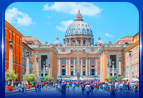
นครรัฐวาติกัน โรม