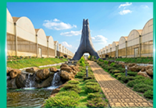
Agro Vege Farm