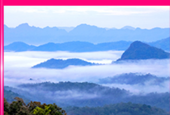
ทะเลหมอก ดอยหัวหมาก