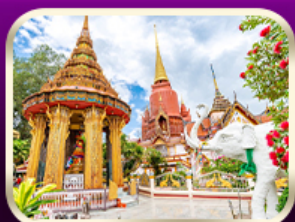
หอพระหลวงปู่ทวด วัดช้างให้