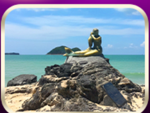
เที่ยวหาดสมิหลา สงขลา