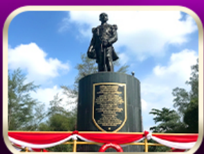
อนุสาวรีย์กรมหลวงชุมพรฯ