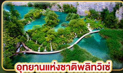
อุทยานแห่งชาติพลิวีเซ