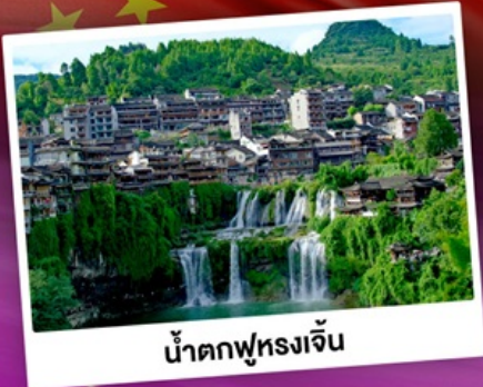
น้ำตกฟุรงเจิน