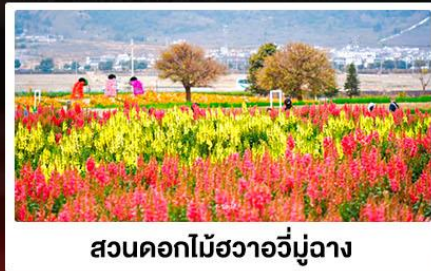
สวนดอกไม้ฮาวอวี๋มูฉาง