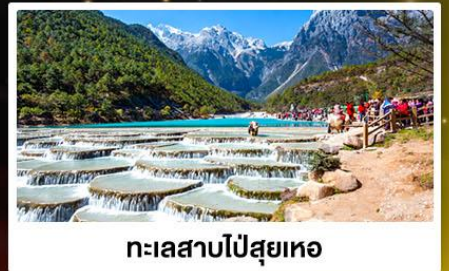
ทะเลสาบไป๋ซุ่ยเหอ