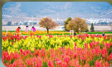
สวนดอกไม้ฮวาอวี๋มู่ฉาง