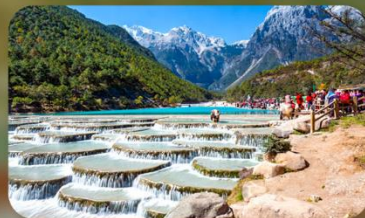
ทะเลสาบไป๋สุยเหอ