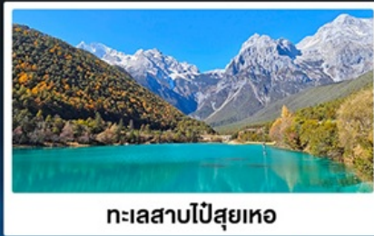
ทะเลสาบโป๋สยเหอ