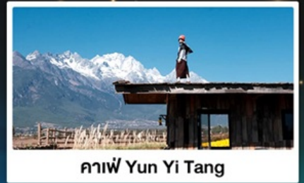
กาแฟ Yun Yi Tang