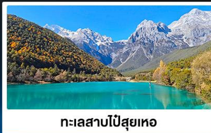
ทะเลสาบโป๋ส่วยเหอ