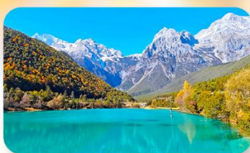
ทะเลสาบไป๋สุ่ยเหอ