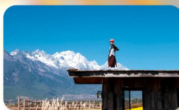
กาแฟ Yun Yi Tang