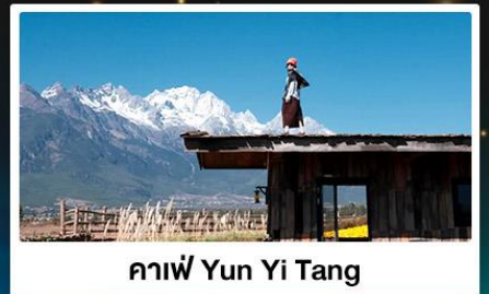
กาแฟ Yun Yi Tang