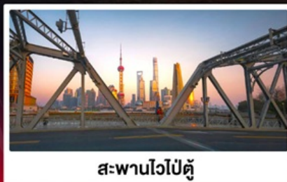
สะพานไวตัน