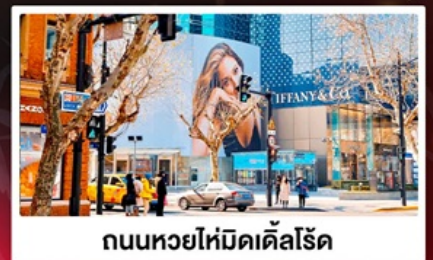
ถนนหยไห่มิดเดิลโรด