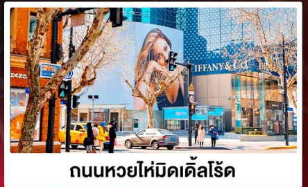
ถนนหยงไห่มีดเคิลโรด