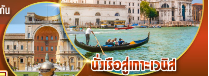
นั่งเรือสู่เกาะเวนิส