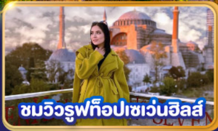
ชมวิวยุฟทือปเซเวนฮิลส์