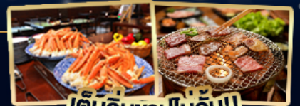
ได้มีอู่นาปูไม่อื่น!! และบิงย่างสไตล์ญี่ปุ่น

สัมผัสความยิ่งใหญ่ กำแพงหิมะ เทือกเขาแอลป์ญี่ปุ่น ดื่มตำรรมชาติของคามิโคจิ เชคอินที่หมู่บ้านชิราคาวาโกะ ชมฟูจิฤดูใบไม้ผลิ ไอซ์ชิพาร์ค ชมทุ่งชิบะซากุระ ศาลเจ้าฟูชิมิ อินาริ ถนนชาเขียววูจิ เยือนปราสาทโอสากา ซอปปิงย่านชินไซบาชิและอาซากุสึ