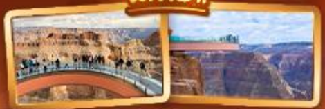
ชมความยิ่งใหญ่ของ GRAND CANYON WEST SKYWALK