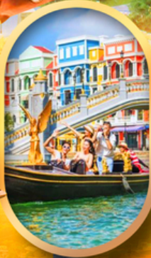
เวนิสแห่งเวียดนาม