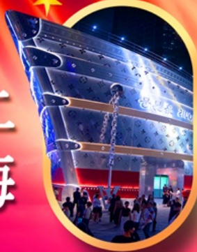
เรือเดอะหลุยส์