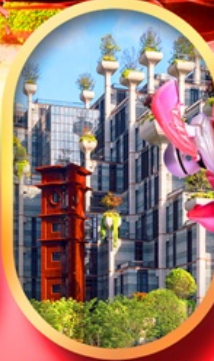
อาคารพินตันโบ