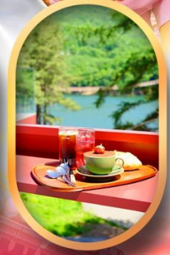
คาเฟ่ลับกลางป่า