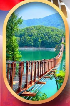
สะพานแขวนมาจิง