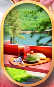
คาเฟ่ลับกลางป่า