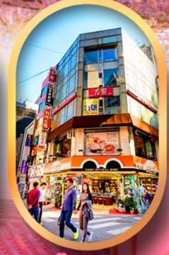
ช้อปปิ้งย่านเมียงดง