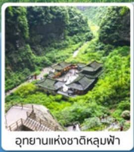
อุทยานแห่งชาติหลุมฟ้า

ไฮไลท์! อุทยานเขานางฟ้า ดินแดนแห่ง 4 สิ่งมหัศจรรย์ มรดกโลก5A พาหินแกะสลักต้าจู้ เขาเป่าตังชาน อสังการงานแกะสลัก มรดกโลก5A