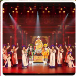
The Heritage Show

● ไอโอล์ก นั่งกระเช้าขึ้นยอดเขาบานาฮิลล์ ชมเมืองโบราณฮอยอัน สักการะเจ้าแม่กวนอิม