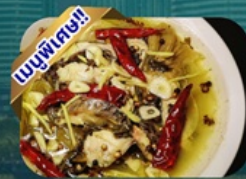
ปลาต้มผักกาดดอง