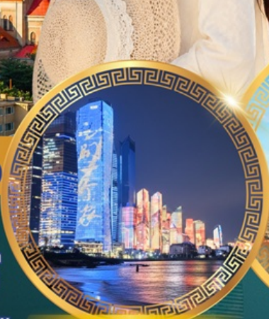
No.3 Bathing Beach

ลานจัดงานเบียร์ชิงเต่า Golden Beach ทางเดินไม้ริมทะเล ศาลเจ้าเทพทะเล ถนนคนเดินโตตง พิพิธภัณฑ์เทศบาลชิงเต่า สวนสาธารณะซิกแนลฮิลล์ ถนนหลงเจียงสู่ กระเช้าภูเขาไท่ผิง ยาน Da Bao island โบสถ์ st.Michael's Cathedral ถนนจงซาน ถนนคนเดินฟิลาฮาร์โมนี จัตุรัสเมย์ไฟร์