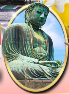
พระใหญ่คามาคุระ