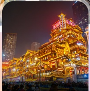
ตลาดหงหย่าต้ง