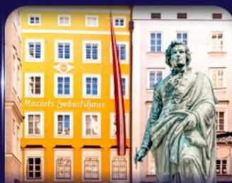
บ้านเกิดโมสาร์ท ซาลซ์บูร์ก