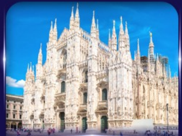
เข็ควินวิหารดูโอโม มิลาโน