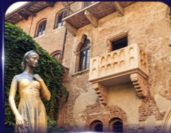
เขื่อนบ้านจูเลียต เวโรนา