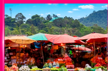
ตลาดดอยมูเซอ