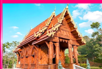
โบสถ์ไม้สักทอง