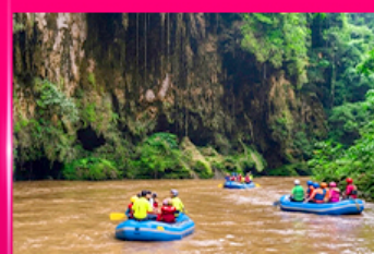
ส่องแก่ง ทีลอจ๋อ - ทีลอสซู