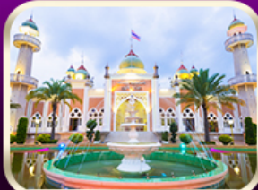
ชมมัสยิดกลางปัตตานี