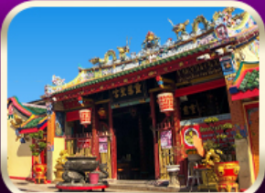
ศาลเจ้าแม่ลิ้มกอเหนี่ยว

ที่เที่ยวเพิ่มขึ้น และ ช่วยฟื้นฟูเศรษฐกิจขนาดใหญ่