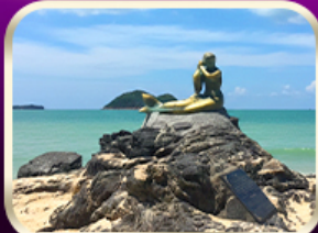
เที่ยวหาดสมิหลา สงขลา