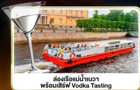
ล่องเรือแม่น้ำเนวา พร้อมลิ้ม Vodka Tasting