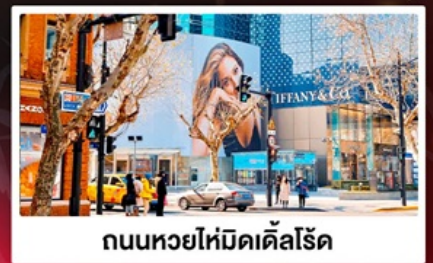
ถนนหยไห่มิดเคิลส์โรด