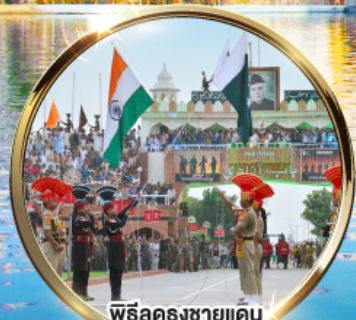
พิธีฉลองชายแดน อินเดีย-ปากีสถาน ด่านวากาห์

บินภายในไป-กลับ DEL ATO IXC DEL หนังผลไม้สด