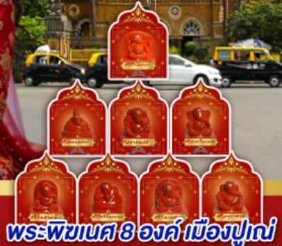
พระพิฆเนศ 8 องค์ เมืองปูเน่