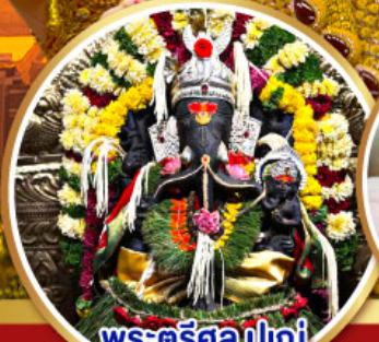
พระตรีศูล ปูเน่ (Trishul Pune)