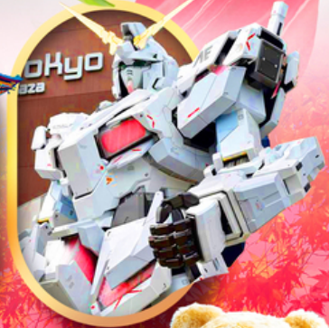
ห้างไอโดะ-กันดัม