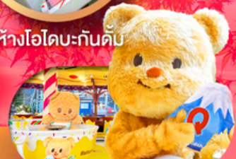
Fuji q Highland x Butterbear เดินทาง พ.ศ. 69 เป็นต้นไป