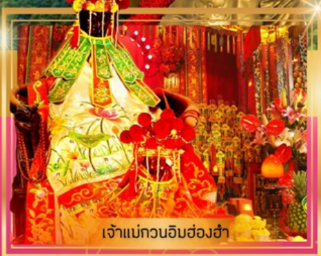
เจ้าแม่กวนอิมฮ่องอ่า