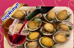
ซีฟู้ด เป๋าฮื้อ+ไวน์แดง