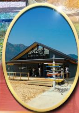
Ao Lakeside Cafe