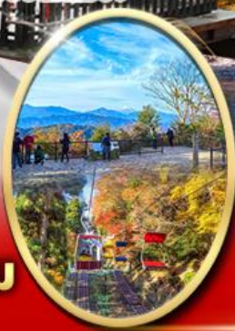
ภูเขา ทาคาโอะ

ปราสาทดสิโมโต้ Starbuck Snow Peak Land วัดชินโซจิ