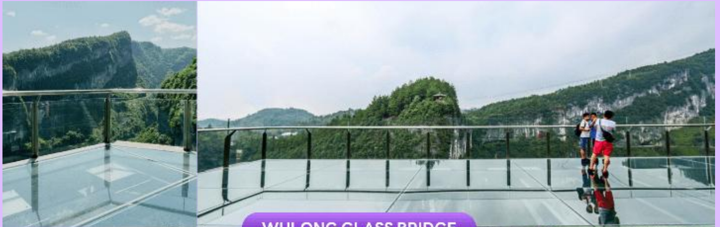
WULONG GLASS BRIDGE