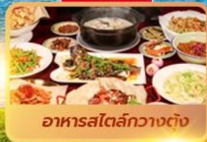
อาหารสตรีทกวางตุ้ง