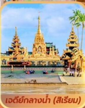
เจดีย์กลางน้ำ (สิเรียม)