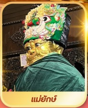
แม่ยี่กษ