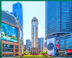
ช้อปปิ้งย่านเจียงฟางเป่ย์