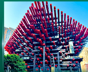
เช็กอินตึกตะเกียบ