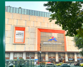
ศูนย์การค้าส่งเสื่อผ้าไผ่ไฟลท์