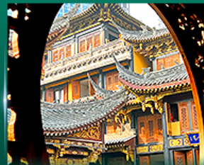
วัดหวงวัดหลิวฉัน