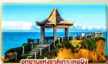
อุทยานแห่งชาติเกาะเหอผิง

เมืองไทเป หรือเทียบเท่า 4* ตามมาตรฐานไต้หวัน