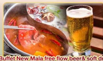
*Buffet New Mala free flow beer& soft drink