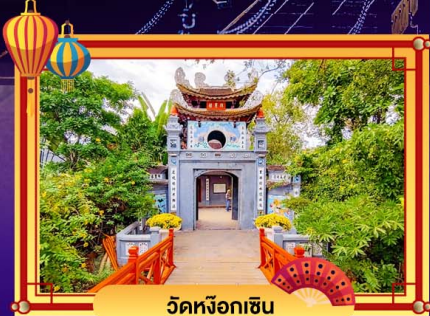
วัดหังจ็อกเชิน