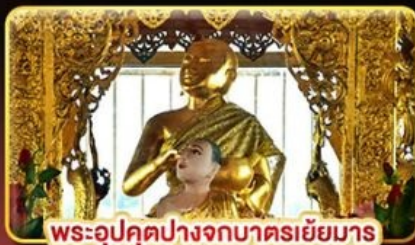
พระอุปคุตปางจกบาตรเขี่ยมาร