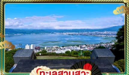
ทะเลสาบสุมะ