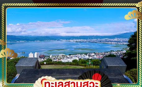
ทะเลสาบสุวะ

เส้นทางธรรมชาติ จุดชมวิวกาเบเนออลปี เที่ยวครบ ใช้รถทุกวัน ไม่มีวันอิสระ