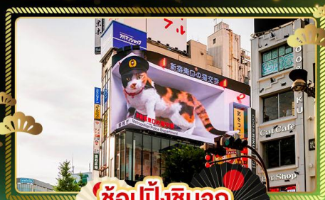
ช้อปปิ้งซินจูกุ