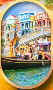
เวนิสแห่งเวียดนาม