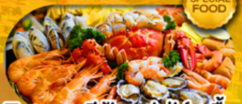
พิเศษเมนูซีฟู้ดบุฟเฟ่ต์ 11 มื้อ เดินทาง มีนาคม 2569