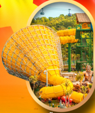
สวนน้ำ Hon Thom