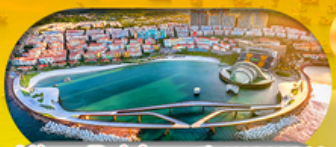
Kiss Bridge สะพานจูบ รวมค่าเข้าสะพานจูบแล้ว