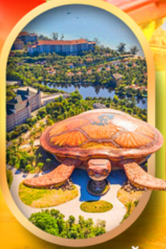
พิพิธภัณฑ์สัตว์น้ำ