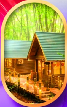
นิงเกิลทอเรียส