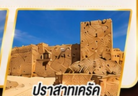
ปราสาทแคร็ก