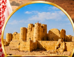
กลุ่มปราสาททะเลทราย (Desert Castles)